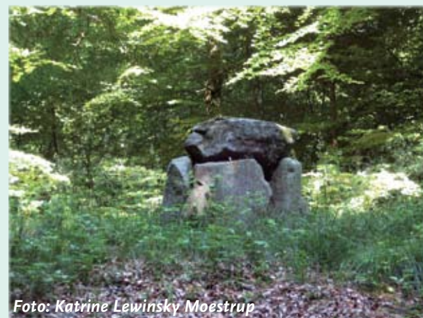
Det falske dyssekammer. Set fra syd.

For ca. 200 år siden byggede herskabet på Moesgård et stenkammer på denne bronzealderhøj. På det tidspunkt dyrkede man oldtidens storhed. Gravhøjen med stenkammeret indgik i Moesgårds daværende imponerende haveanlæg, hvor en menneskeskabt lysning i skoven gik fra haven ned til Nordre Strandmark.