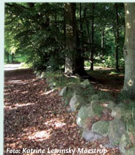
Dige mellem skov og strand. Set fra Nordre Strandmark.

De fleste diger stammer fra begyndelsen af 1800-tallet, da de danske skove blev fredet. Kun 4 % skov dækkede Danmark, hvor der i dag er 14 %. Digerne dannede skel samt indrammede skov, der skulle beskyttes mod græssende dyr og tyveri. Digerne består af enten sten eller jord og har ofte en grøft på den ene side.