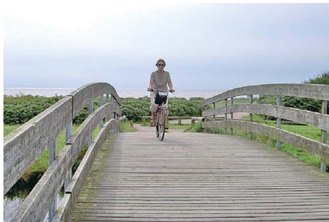
Bro over Egåen

Landskabet nord for Århus er et typisk østjysk bakkelandskab, der er formet af sidste istids gletchere og de smeltevandsfloder, som løb under de massive ismasser. Egådalen var for 12.000 år siden en sådan tunneldal, hvor store smeltevandsmasser fossede mod vest, i modsat retning af den mere fredelige Egås nuværende østlige strøm. I 1987 vedtog man en lokalplan, som sikrede en sti til offentlig færdsel langs Egåens udløb. Stien længde er 2 km.