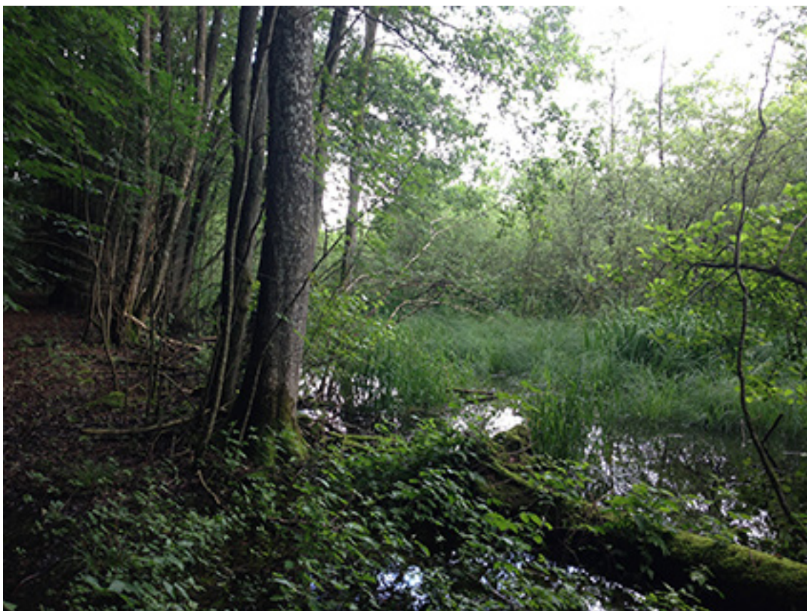
Elle- askeskov i høj naturtilstand ved Tåstrup sø.

Projekterne gennemføres ved frivillige aftaler, og derfor er det i mange tilfælde ikke på nuværende tidspunkt muligt at beskrive hvornår projekterne fysik bliver udført. Kommunen vil i hvert enkelt tilfælde sørge for, at relevante interessenter bliver inddraget.