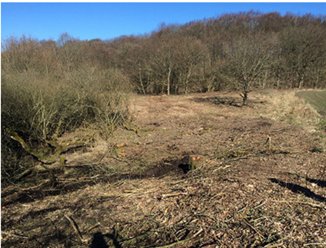
Rydning af buske- og træer på kalkoverdrev.

Indsatsen udføres af kommunerne og lodsejere i området og gennemføres i videst muligt omfang gennem frivillige aftaler. Der findes blandt andet en række tilskudsordninger, som kan søges gennem Landbrugs- og Fiskeristyrelsen.