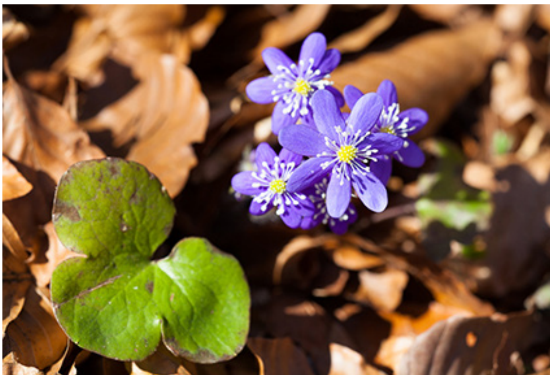
Blå anemone findes i Stjær Stenskov og Lillering Skov.