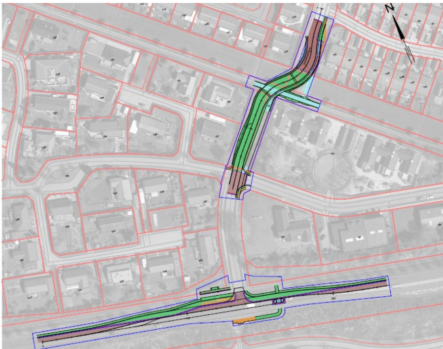
Figur 3: Løsningen med udkørsel til Jernaldervej, som er fastlagt i vilkår 7

Bygherre indrømmede, at ekspropriationssagen led af en væsentlig mangel, da der ikke var meddelt dispensation fra lokalplan 002, for så vidt angår etablering af en vejforbindelse gennem det grønne område, og bygherre trak derfor ekspropriationskravet ift. vejgennembrudet til Jernaldervej. Den øvrige del af ekspropriationen langs Viborgvej blev gennemført.