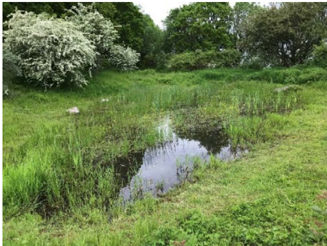
Foto: Ynglelokalitet for stor vandsalamander. Strandmarken – Marianne Popp